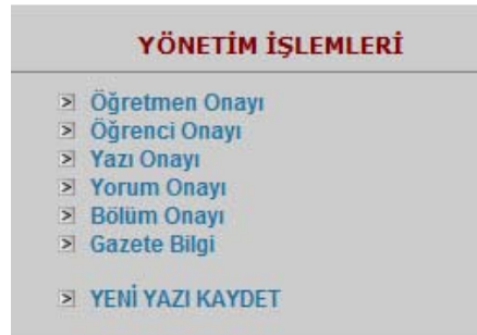
Şekil 2 Yönetici öğretmen işlem menüleri

Yönetici Öğretmen Ekranı : Sistemin ana sayfasından kullanıcı adı ve şifre ile giriş yapılır. Üyelere kayıt türlerine göre farklı ekranlar açılır. Yönetici panelinde; öğretmen onayı, öğrenci onayı, yazı onayı, yorum onayı, bölüm onayı, gazete bilgi ve yeni yazı kaydet bağlantıları bulunmaktadır(Şekil 2).