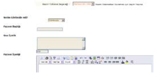
Şekil 7 Yeni yazı ekleme menüsü

dederken, yazı ile ilgili küçük resim, yazının başlığı, yazıyla ilgili kısa içerik, yazının metni- ne ekleyebilir, yazının sistemde yayınlanması gereken konumu ve yazının ekleneceği bölümü belirleyebilir(Şekil 7).